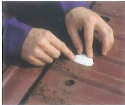
Oder Roststellen an Ihrem Auto zuschmieren.