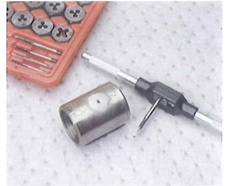
Oder überdrehte Gewinde neu schneiden.