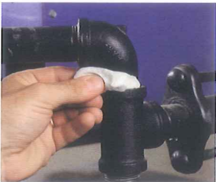
Oder das undichte Rohr schnelligst abdichten.