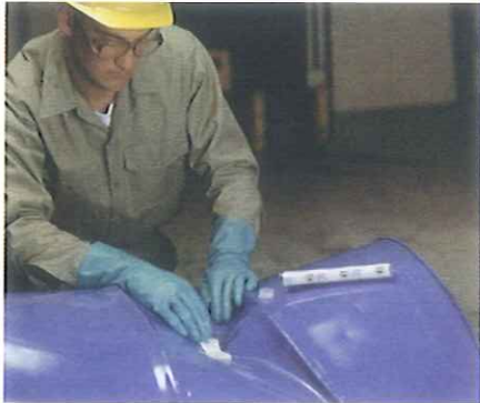
Ein Loch in der Trommel schnell und mühelos verkitten.