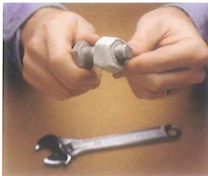
Oder Gegenstände wie diese Mutter „herstellen“.