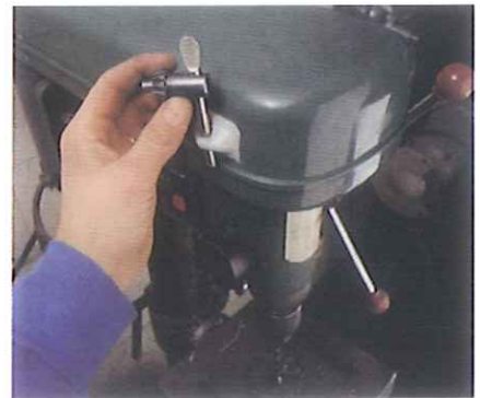
Oder Teile wie diesen Spannhalter anfertigen.